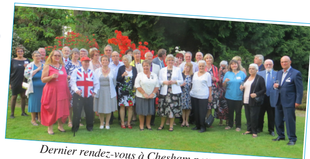
Dernier rendez-vous à Chesham pour un week-end anglo-franco-allemand ensoleillé et chaleureux