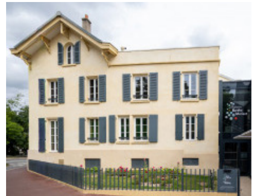
Maison Berthe Morisot à Bougival

Depuis décembre 2024, la ville de Bougival a créé un musée dédié à Berthe Morisot, dans la maison qu'elle a occupée de 1881 à 1884. On peut s'y immerger dans l'univers de l'artiste, et voyager au cœur du Bougival du 19 ème siècle et de la vie culturelle de l'époque en suivant un parcours interactif.