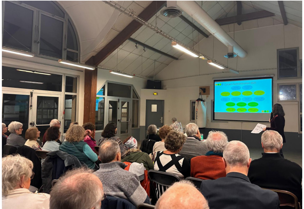
Assemblée Générale du comité de Jumelage : présentation des projets pour 2026

Visite de la maison Berthe Morisot à Bougival