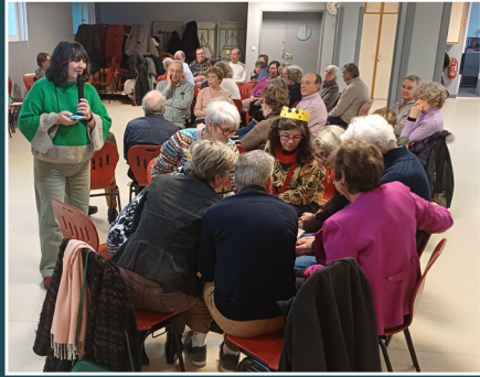
Galette du jumelage : tous se concertent pour trouver la réponse au quiz