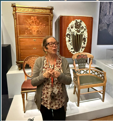
une conférencière passionnante nous présente cent ans d' Art Déco