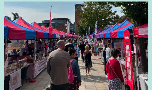
Marché à Stratford-upon-Avon

Les marchés les plus célèbres se trouvent à Londres comme le Borough Market lieu très apprécié où déambulent Londoniens et touristes. En France, la plupart des marchés sont gérés par les municipalités. En Angleterre, l'organisation est souvent privée. Derrière, il y a soit une entreprise qui rémunère des gens pour organiser