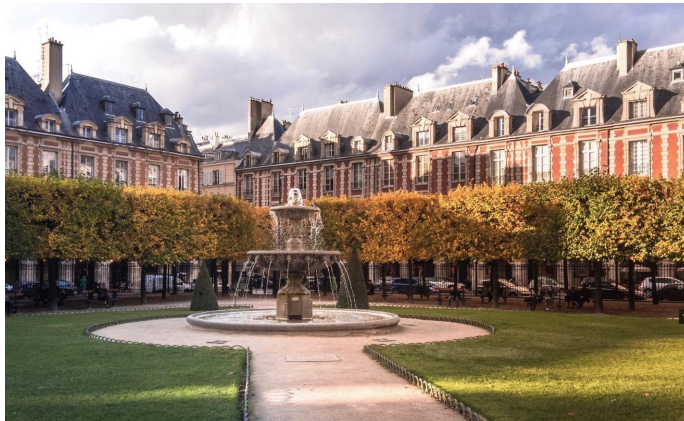
Place des Vosges

Vive le Jumelage ! C'est reparti pour de nouvelles aventures ! AMM&LF