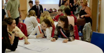
Réception en mairie avec le CMJ de Houilles et présentation des actions