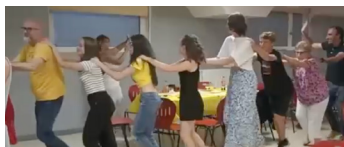
Et, pour terminer ce sympathique week-end : Soirée festive...

...au cours de laquelle nos jeunes invités nous offrent des livres pour notre boîte à livres multilingues