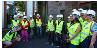
Samedi matin, visite du SITRU