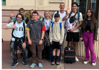
Après une agréable pause pique-nique visite de l'espace «Sol Majeur» des «Jardineurs Sartrouillois»