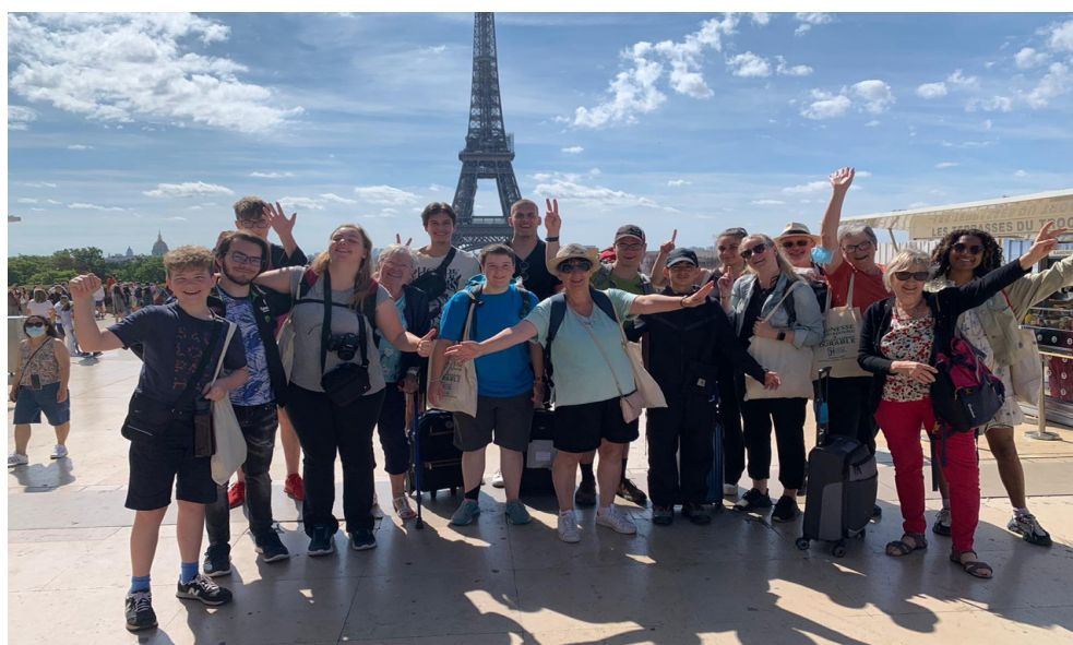
Grande finale du week-end des CMJ : découverte de la tour Eiffel