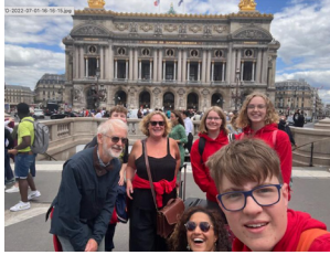
On réfléchit au questionnaire sur le développement durable

Vendredi 1 er juillet Arrivée de nos visiteurs, quatre Anglais, huit Portugais, huit Allemands