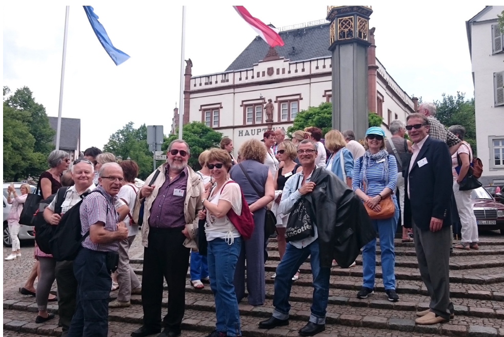
Rencontre franco-anglo-allemande au cours d'un week-end international à Wetzlar