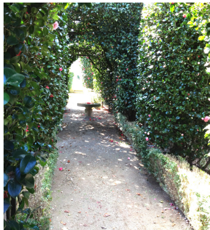
Allée de camélias à Celorico de Basto

Pour honorer ce titre, les Celoricences plantent chaque année l'un d'entre nous, acheté sur le marché de la Férià Internationale des Camélias. Cette fête a lieu en mars, depuis 17 ans et attire de nombreux visiteurs. On peut y admirer et même acheter les plus belles variétés et compositions florales, récompensées par un jury.