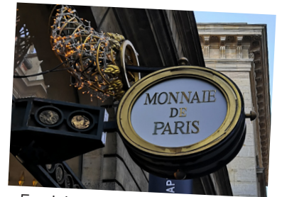
En visite à la Monnaie de Paris