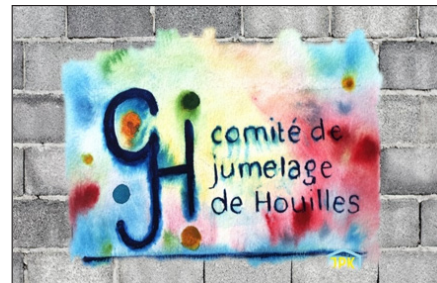
Street Art par JP Kosinski