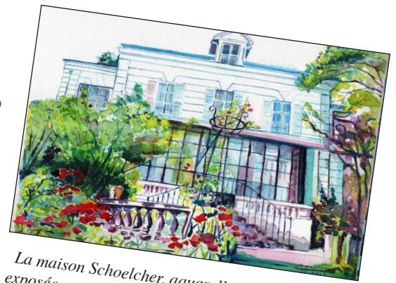
La maison Schoelcher, aquarelle de JP Kosinski exposée au salon des Artistes locaux - Graineterie