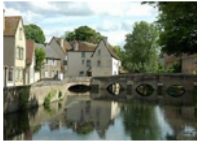
Chartres : Un petit coin sympathique

Samedi 8 Juin, « bon pied bon œil », départ en car pour la découverte de la ville de CHARTRES. Les retrouvailles sont toujours très animées dans les cars, la cacophonie des conversations dans les quatre langues ne manque