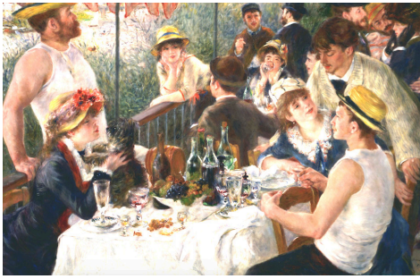
Pierre Auguste Renoir : Déjeuner sur l'eau

Vous voyez le raccourci, le thème de la prochaine soirée des adhérents sera les Guinguettes. Alors, une p’tite gigue sur leurs traces?