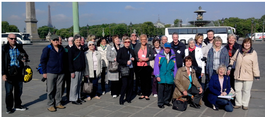
Sur la route de l'Assemblée Nationale...un temps de pause place de la Concorde

Nous y voilà, après des mois de préparation, le week-end de Pentecôte, traditionnel rendez-vous avec nos villes jumelées, est enfin arrivé.