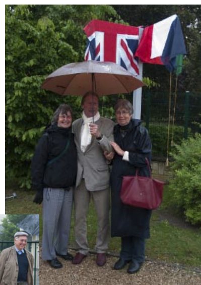
Les trois présidents sous le panneau directionnel

L undi matin surprise, la pluie fait des claquettes au parc Charles de Gaulle. C'est donc sous des parapluies multicolores que nous assistons à l'inauguration du poteau directionnel et à la remise par nos amis allemands du Baumelbank écarlate, que l'on pourra retrouver dans le parc Jemmapes.