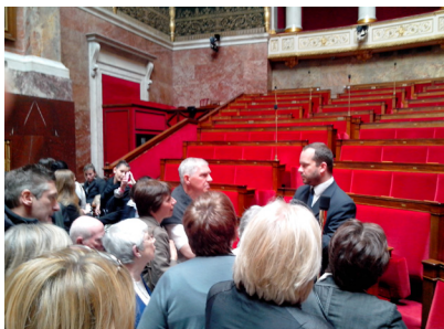
Le guide de l'Assemblée Nationale nous commente la visite dans les deux langues.

Le groupe anglais, après la visite, déjeune à la brasserie "Le Bourbon" puis marche jusqu'au Louvre sous un beau soleil printanier.