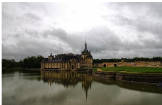
Le chateau de Chantilly sous un ciel chargé