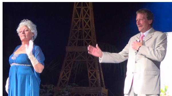
The Queen and 007 of course

D imanche matin, départ pour Chantilly en car, le temps est un peu gris ce jour mais la pluie va nous épargner. Sitôt arrivé, nous visitons les écuries et assistons à une superbe démonstration équestre commentée par une jeune écuyère à la dialectique irréprochable nous disséquant l'art de monter à cheval.