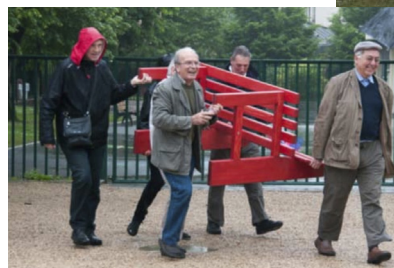
Arrivée du banc

L a pluie précipite les adieux, chacun repart empli du souvenir de ce merveilleux week-end, en se promettant de se revoir lors d'une prochaine rencontre. □ JPC