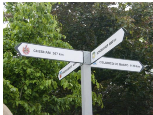
Si loins, et pourtant si proches

Cette année est particulière car elle marque les 40 ans de jumelage avec Friedrichsdorf et le Comité de Jumelage de Houilles a tenu à marquer l'événement au travers d'un très riche programme.