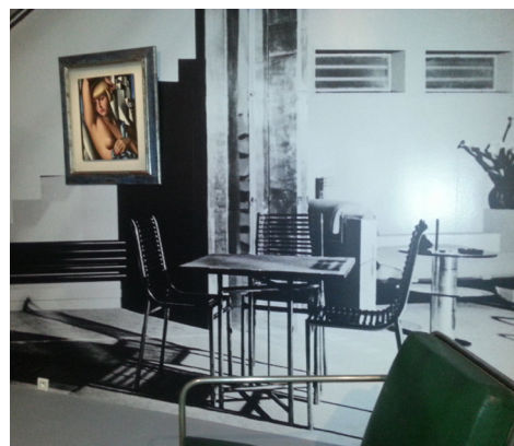
Intérieur Art Déco

Symbole de l'Art Déco, il est représenté au centre de la toile avec son confrère Basin, le sculpteur Janniot, le peintre Bouquet au côté de son modèle Josépha.